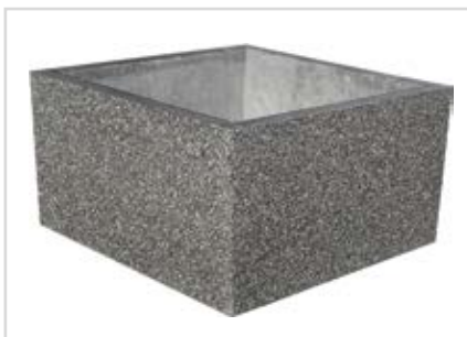
Granit Sandstrahleffekt Alpin Grau