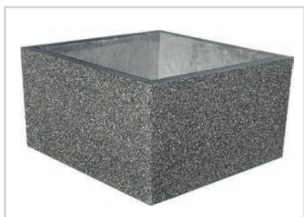
Granit Sandstrahleffekt Alpin Grau